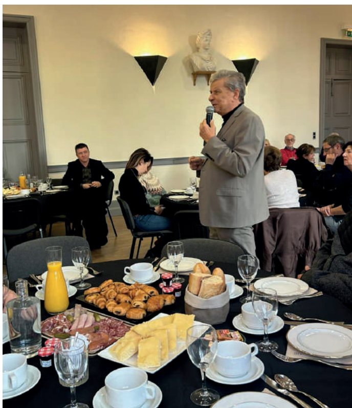
PETIT-DÉJEUNER DES NOUVEAUX UZÉTIENS

Entouré de plusieurs élus, Mr le Maire présente la ville et pose des questions aux nouveaux arrivants à travers un petit quiz qui permet de remporter des cadeaux sur l'histoire d'Uzès. Un délicieux petit-déjeuner accompagnait cette matinée conviviale et chaleureuse.