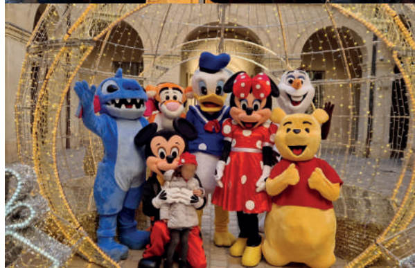
LES MEMBRES DU COMITÉ DES FÊTES IMPLIQUÉS ET DÉGUISÉS