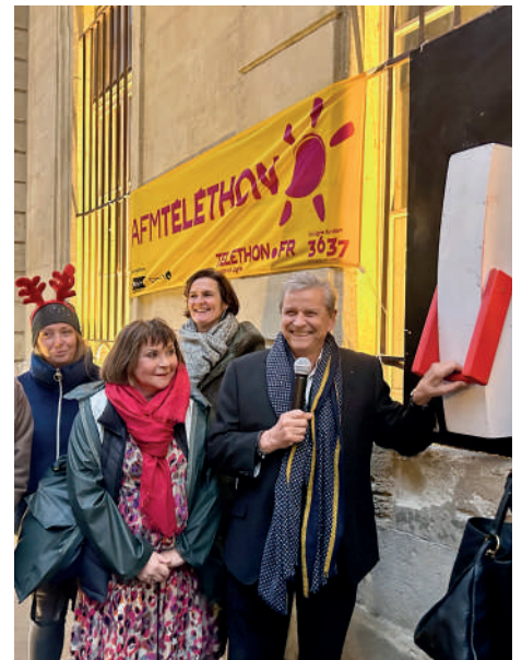
ÉCLAIRAGE DES ILLUMINATIONS DE NOËL

Une initiative qui s'inscrit dans la continuité de la baisse de l'éclairage public chaque nuit.