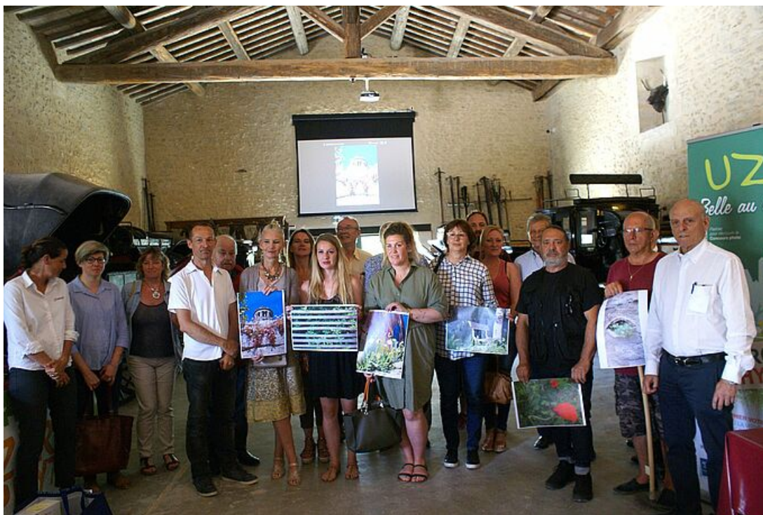
Les lauréats du concours photo Zéro phyto Uzès 2e édition, Printemps