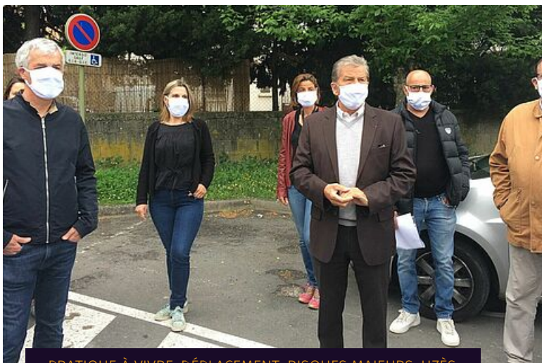
PRATIQUE À VIVRE, DÉPLACEMENT, RISQUES MAJEURS, UZÈS