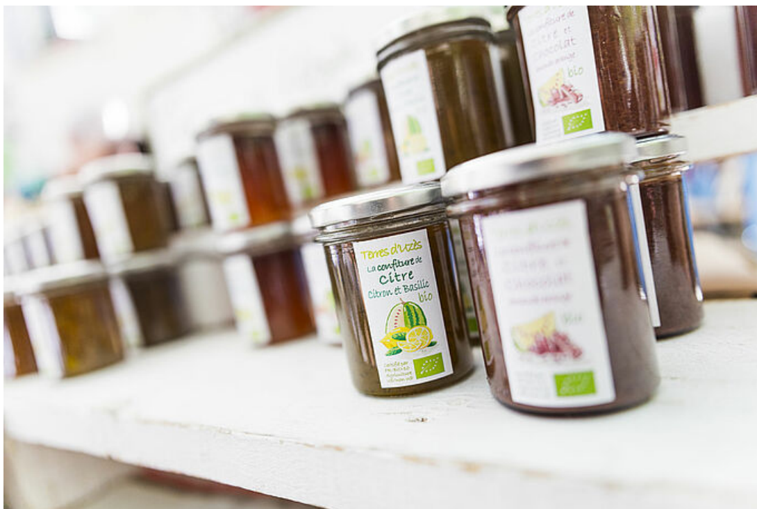
Les marchés d'Uzès du mercredi et du samedi sont ouverts.

Les marchés d'Uzès du mercredi et du samedi sont maintenus pour les commerces alimentaires ou proposant la vente de graines, semences et plants d'espèces fruitières ou légumières, suite aux décisions gouvernementales.