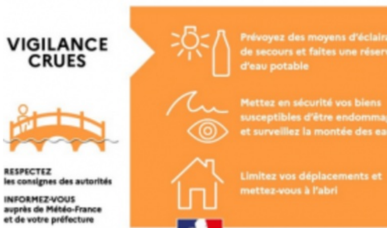
DÉMARCHES, INONDATION, RISQUES MAJEURS