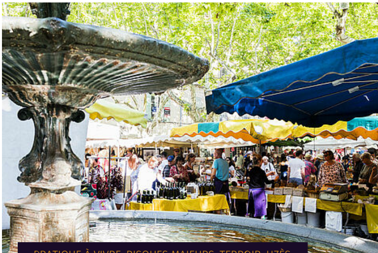
PRATIQUE À VIVRE, RISQUES MAJEURS, TERROIR, UZÈS