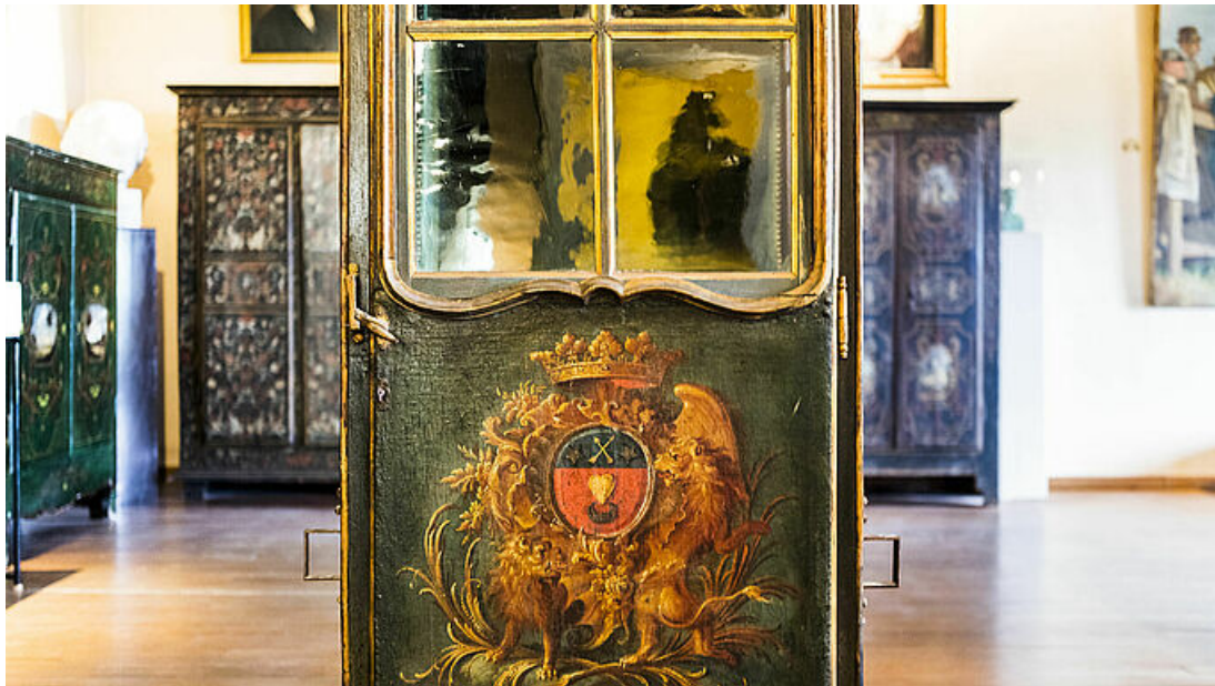
Musée Georges Borias d'Uzès