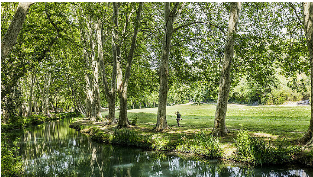
La Vallée de l'Eure d'Uzès

projet se devait donc de contribuer à la découverte du patrimoine uzétien.