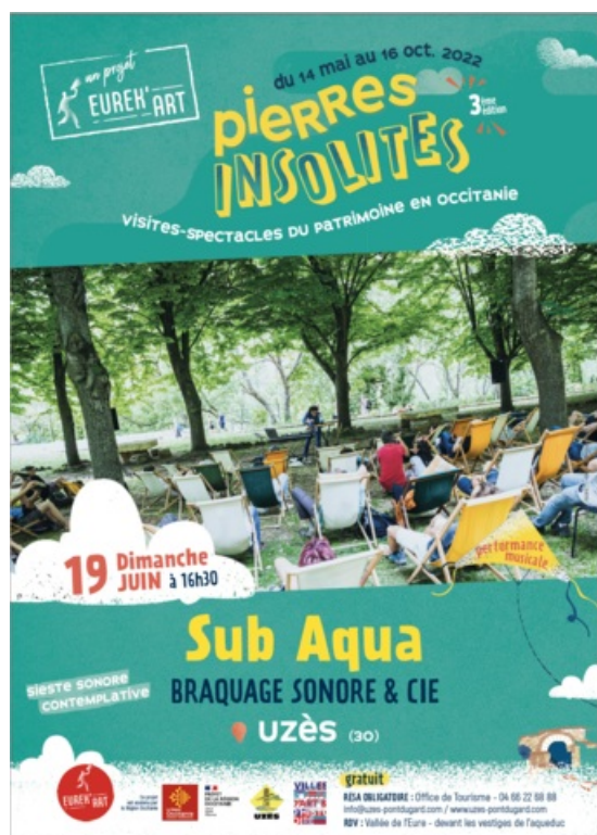
Affiche "Pierres insolites"