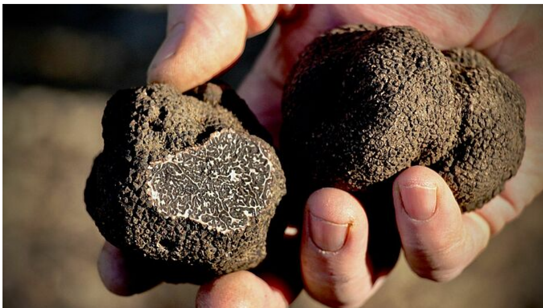
Tuber melanosporum, truffe noire récoltée dans le Gard.