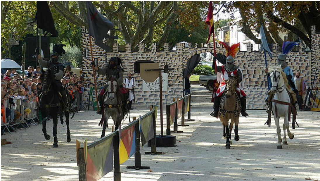
Les Médiévales d'Uzès, 24 et 25 octobre 2020 à Uzès, Photo Ville Uzès, archives

Oyé Oyé, Préparez vous, la nouvelle édition des Médiévales d'Uzès arrive les samedi 24 et dimanche 25 octobre 2020 ! Entre chevalerie et fauconnerie, cavaliers et troubadours, le programme proposé par l'association des commerçants Les Dynamiques d'Uzès est complet. Animations, spectacles, découvertes, marchés, et visite guidée attendent petits et grands. Venez découvrir une autre époque dans un cadre d'exception, la cité ducale et pourquoi pas vous déguiser pour l'occasion ? "Il s'agissait d'une demande de la population et des commerçants" rappelait la présidente de l'association. Refaire l'histoire sur deux jours est de nouveau la défi relevé par toute l'équipe. Le défilé d'ouverture du samedi 24 octobre à 11h où tout le monde peut être costumé grâce à la location sur place de déguisements (samedi de 10h à 18h, à la mairie, à partir de 10 € le déguisement).