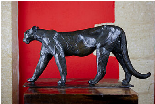
Le puma, Rembrandt Bugatti.

influence sur l'Art nouveau. Les meubles de Bugatti étaient connus pour leurs couleurs riches, leurs ornements détaillés et leurs formes élégantes et asymétriques. Des pièces de mobilier conçues par Carlo Bugatti sont exposées dans de nombreux musées à travers le monde. En raison de leur rareté et de leur importance historique dans le mouvement de l'Art nouveau, les meubles Bugatti sont hautement prisés par les collectionneurs et amateurs d'art.