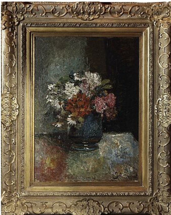
Le bouquet, Monticelli © Ville d'Uzès

Rembrandt Bugatti est principalement connu pour ses sculptures animalières en bronze réalistes et émouvantes. Elles reflétaient fidèlement la structure corporelle de ces animaux, y compris les proportions et les formes des différentes parties du corps. Ses créations sont caractérisées par leur minutie anatomique, leur réalisme et leur expressivité . Ces œuvres ont fait de lui l'un des sculpteurs les plus renommés de son époque.