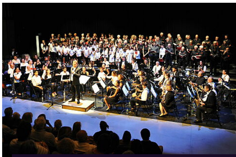
CULTURE ET PATRIMOINE, ÉCOLE MUNICIPALE DE MUSIQUE D'UZÈS, ÉVÉNEMENTS, FESTIVITÉS, UZÈS