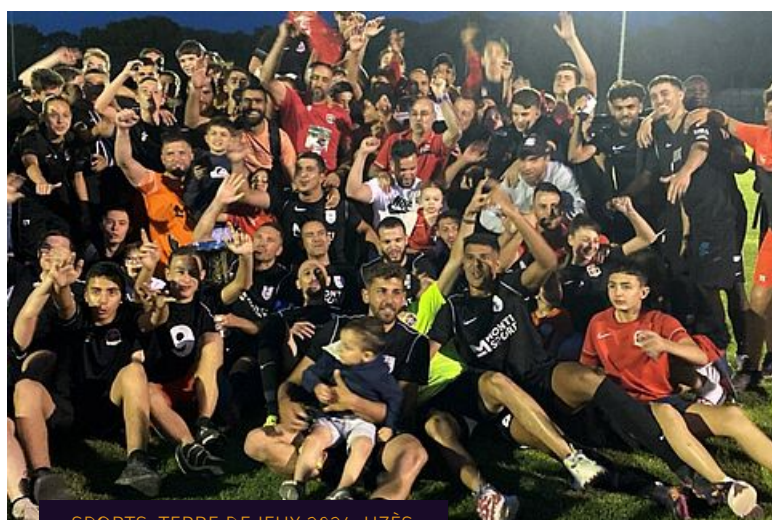
SPORTS, TERRE DE JEUX 2024, UZÈS