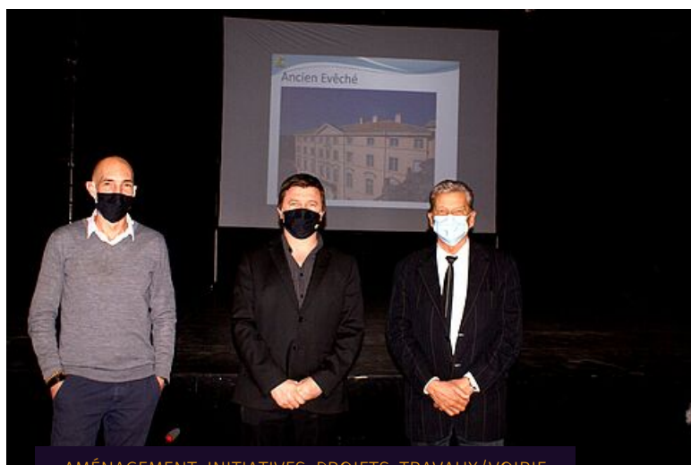
AMÉNAGEMENT, INITIATIVES, PROJETS, TRAVAUX/VOIRIE