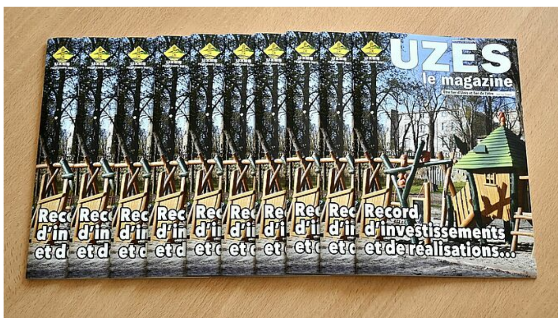
Revue municipale Printemps 2022

Le nouveau numéro du magazine d'information de la municipalité est paru mi-avril. Il retrace toutes les réalisations actuelles et à venir dans une interview du maire d'Uzès, Jean-Luc Chapon. Vous l'avez trouvé dans vos boîtes aux lettres et dès à présent sur le site de la Ville dans la rubrique "ma mairie", magazine publication, publication et en Une du site internet dans "A lire" .