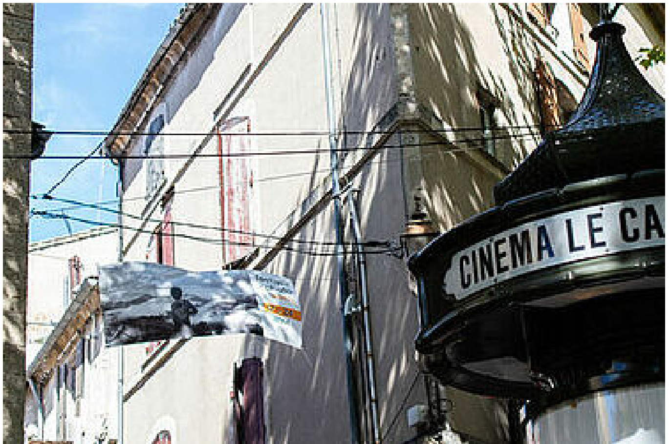
Cinéma Le Capitole d'Uzès