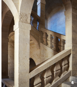
4. Escalier à 4 noyaux