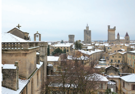
8. Les toits d'Uzès