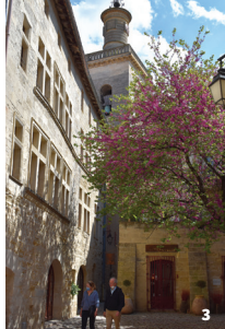
3. Place André Malraux