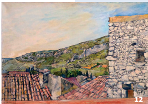
12. Gaston-Louis Roux