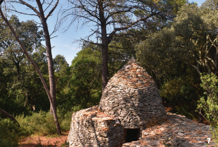
7. Sentier des capitelles