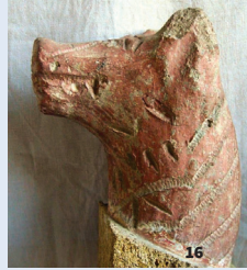
16. Chenet zoomorphe de l'âge du Fer © Musée G. Borias - Ville d'Uzès

l'abstraction. Il s'en détache à partir des années 1950, choisissant de revenir à une peinture figurative et méditative, qui privilégie les paysages de Seynes, dans le Gard, où il séjourne chaque été. L'exposition présente une sélection d'une quinzaine de tableaux de 1970 à 1981.