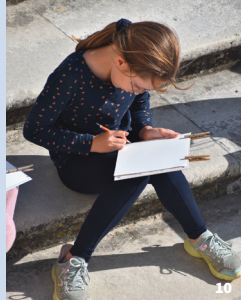
10. À l'école des explorateurs

Visite gratuite, dans la limite des places disponibles. Inscription à l'office de tourisme. Places limitées.