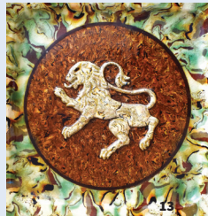
13. Céramique Pichon