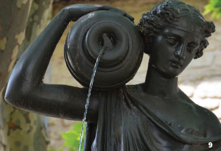
9. Fontaine de la dame