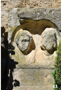
11. Monument funéraire romain © Maison du patrimoine – Ville d'Uzès