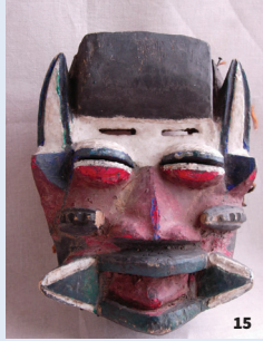
15. Masque Guéré