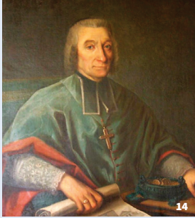
14. Portrait de Mgr Bauÿn