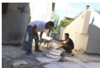
Impasse de la Trompe

La ville d'Uzès s'embellit et poursuit son programme de rénovation du secteur sauvegardé aux Bourgades. Le projet d'extension du secteur sauvegardé validé en 2005 et mis à l'étude en 2010 suite à l'accord des services territoriaux du ministère de la Culture comprend désormais les boulevards, le quartier des Bourgades, les rues Sigalon et du collège. Le nouveau périmètre protégé quadruple ainsi. Sa superficie passe de 11 ha à 47 ha, faisant d'Uzès l'un des plus importants secteurs sauvegardés de France. Lors du conseil municipal du 14 mars 2012, Jean-Luc Chapon, le maire d'Uzès énonçait son intention de poursuivre le projet d'embellissement de la ville pour en favoriser son rayonnement. "Le conseil municipal consacra alors la majeure partie du budget 2012 aux travaux" annonçait-il lors du débat d'orientation budgétaire. L'amélioration de la qualité de vie de la population, la valorisation du patrimoine historique et le développement économique de la ville constituent ainsi les priorités.