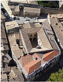
Lancement de la 6e tranche des travaux de couverture de l'Hôtel de Ville, côté boulevard Charles Gide et rue du Salin.