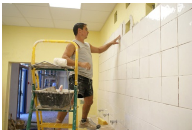
Les sanitaires intégralement rénovés

Il ne reste plus que la reprise de l'ensemble des sols qui comprendra le ragréage, technique visant à nettoyer et aplanir la surface pour apposer un nouveau revêtement sur l'intégralité des espaces comprenant le réfectoire, les sanitaires et l'accueil. Le pôle bâtiment en aura la charge, tandis que l'entreprise Atout sol interviendra sur la pose d'un sol thermosoudé, isolant phonique. Ce programme de rénovation a su prendre en compte les améliorations techniques nécessaires pour un espace positif, moins gourmand en énergies et mieux isolé pour assurer un très grand confort aux élèves pendant la pause méridienne.