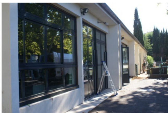
L'école maternelle du Parc : meilleure isolation phonique et thermique

L'école Maternelle du Parc vient d'être rénovée grâce au remplacement de onze nouvelles menuiseries équipées de portes-fenêtres , avec fenêtres à châssis coulissants et à soufflets. Cette installation apporte un confort phonique et thermique. Elle assure une protection solaire supplémentaire grâce aux vitres à faible émissivité et conforte la sécurité de l'école qui accueille 120 élèves à l'année dans un cadre préservé, donnant sur une cour et un grand espace vert arboré.