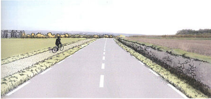
Avant-projet paysager liaison interquartier Mayac-Mas de Mèze.

Ce projet permet de contourner le centre-ville d'Uzès pour l'ensemble des usagers de la route en reliant le quartier récent de Mayac à la RD 981, un axe majeur assurant la jonction avec Montaren, Alès et au-delà l'autoroute A9.