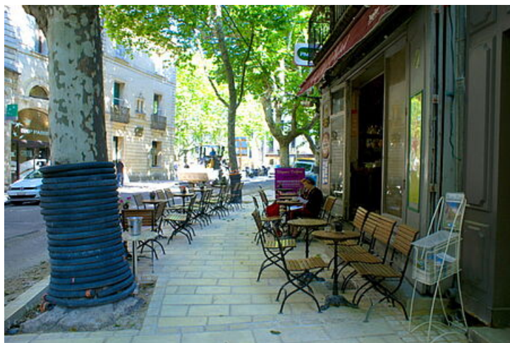
Boulevard des Alliés