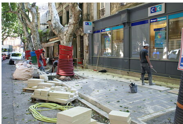
Boulevard Gambetta en cours de pavage. Fin du pavage et de la phase 1 au 31/05/2018